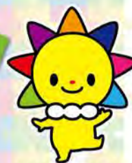
マスコットキャラクターさんまるちゃん