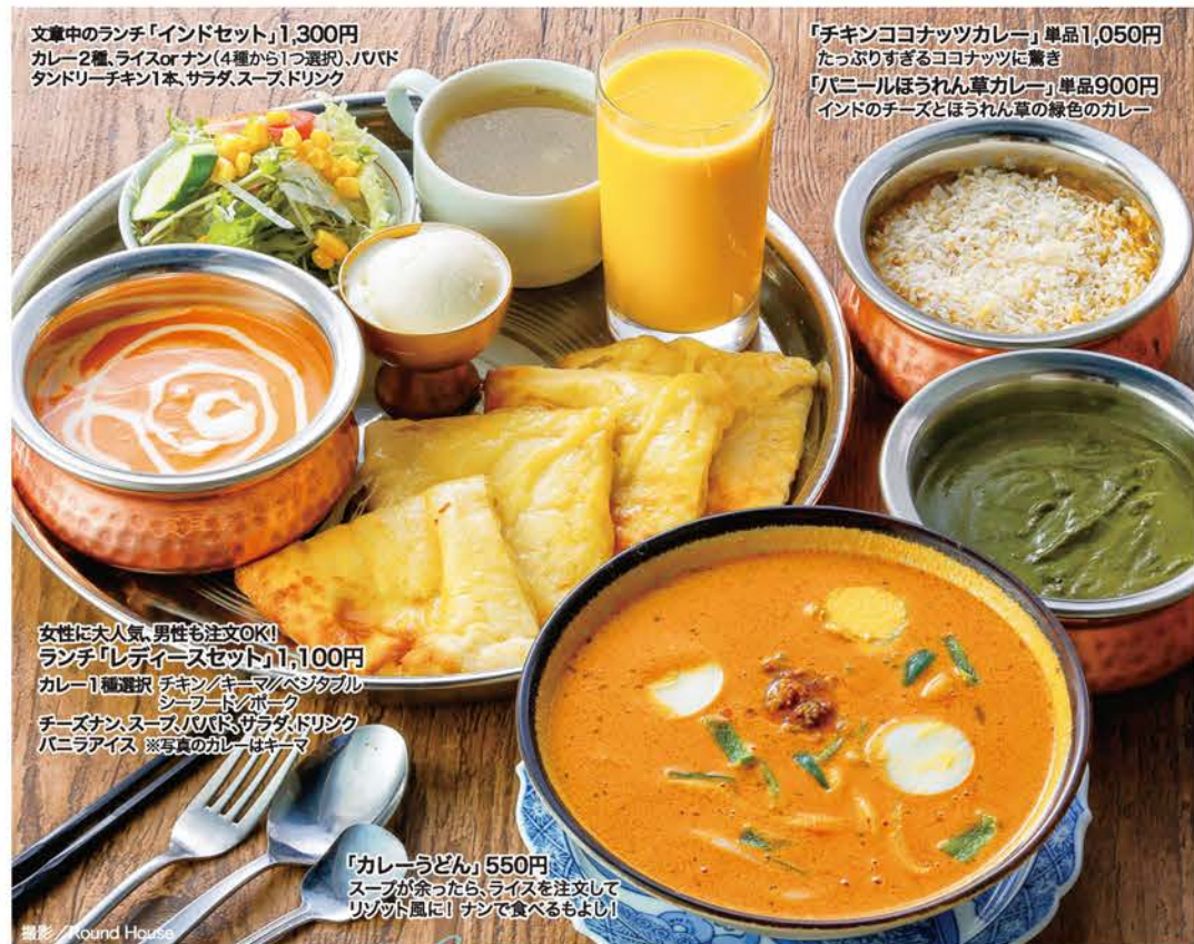
文章中のランチ「インドセット」1,300円 カレー2種、ライスorナン(4種から1つ選択)・JUVIT タンダーチキン1本、サラダ、スープ、ドリンク