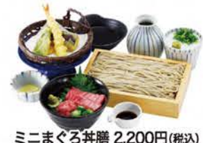
ミニまぐろ丼膳 2,200円(税込)

▶十割そば・天ぷら・国産うなぎ「源内」 住/下松市末武和田 ☎0833-44-0443 休/木曜日 営/11:00～15:00、16:30～21:00