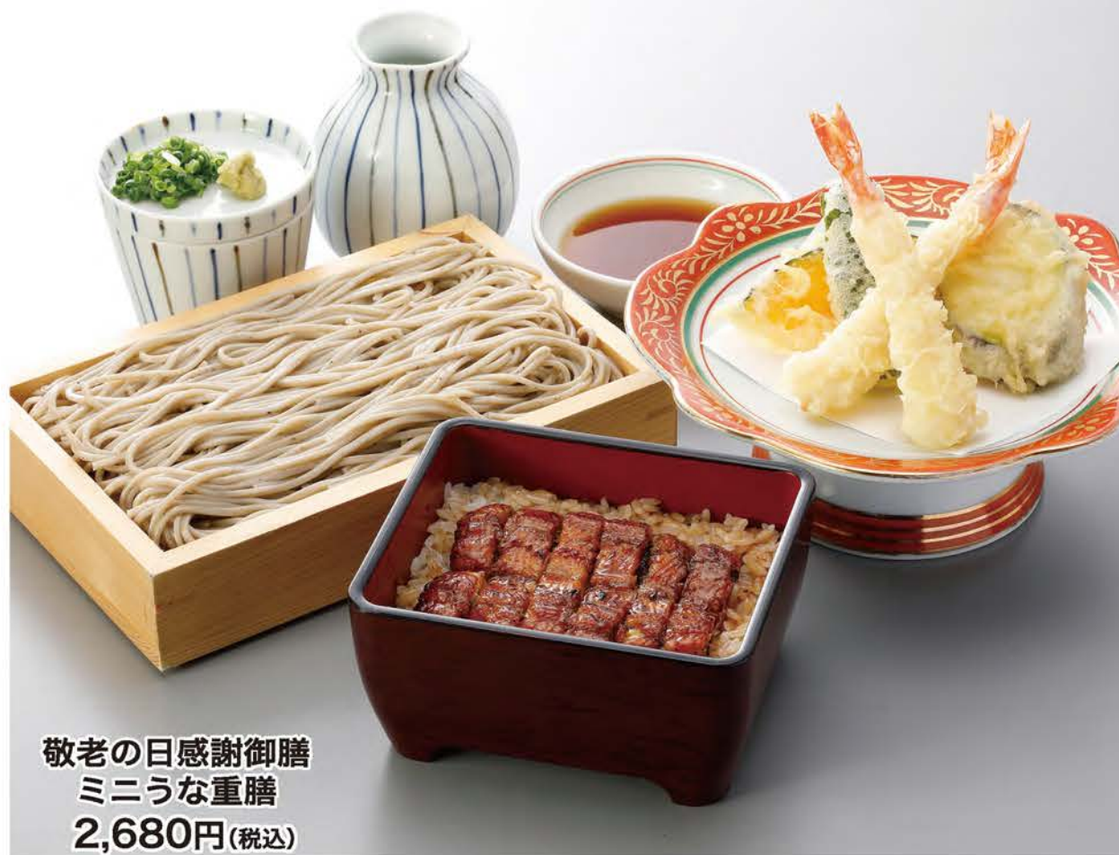
敬老の日感謝御膳 ミニうなぎ重膳 2,680円(税込)

「敬老の日」のお祝いに、源内のそばとうなぎで長寿を祝ってみたいかが！ 9月7日(土)より「敬老の日」感謝フェアを開催致します。 おすすめは、敬老の日感謝御膳の「ミニうなぎ重膳」2,680円(税込)と「ミニまぐろ丼膳」2,200円(税込)の2種類。国産うなぎメニュー全て300円引きします。国産うなぎ重3,300円(税込)を3,000円(税込)、上盛4,300円(税込)を4,000円(税込)、特盛5,300円(税込)に致します。 また、9月7日(土)～13日(金)に「敬老の日感謝御膳」をご注文と右下のクーポンをご提示でお好きなデザートまたはお飲み物を1点プレゼントします。 ご家族連れで「敬老の日」の長寿をお祝いしませんか。