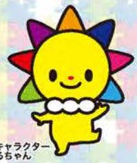
マスコットキャラクターさんまるちゃん