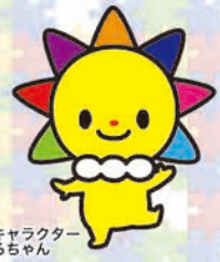
マスコットキャラクター さんまるちゃん