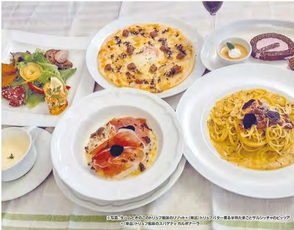
※写真:生ハムときのこのトリュフ風味のリゾット+(単品)トリュフバター薫る半熟たまごとサルシッチャのピッツァ +(単品)トリュフ風味のスパゲティ カルボナーラ