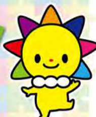
マスコットキャラクターさんまきゅんちゃん