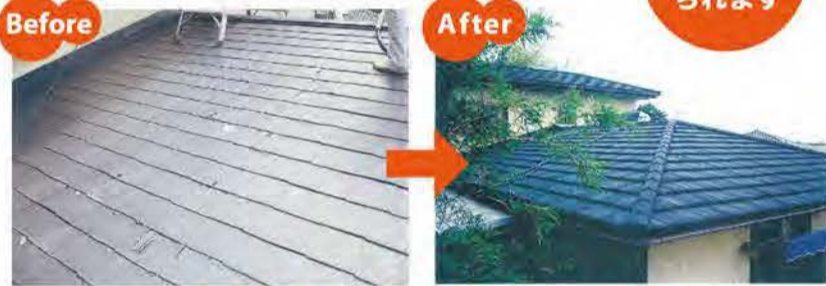
小さな工事でも、お気軽にどうぞ♪

ルーフ・イリエ 防府市富海 2605-1 TEL0835-34-0646 □090-7776-1347