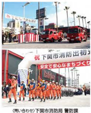
（問い合わせ）下関市消防局 警防課 ☎083-233-9112