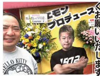
「EMON プロデュース」の文とどさげん

どーもー！2024年も低空飛行ながら、飛び続けたどさげんです！2025年はへび年ということで、へびな体重をキープして頑張ろうと気持ち入りまくっております！2025年も皆様よろしくお祈りいたします！