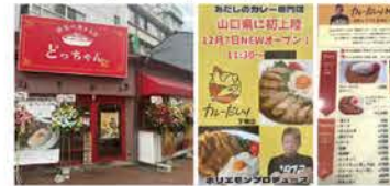
カレーのメニュー

レー、ヒレカツカレー、チキンカツカレーにトッピングは多数。辛さは普通と中辛からえらべちゃいます。どさげんはチキンカツカレーの中辛、ご飯大盛りにしました。カレーがきて、チキンカツのデカさに思わず笑ってしまいました。モモ肉1枚使っているそうです。こりや嬉しい！まずはカレーを一口、最初は高級レストランのカレーの様な上品な口当たりから、一気におだしの味が、欧風と和風のミックスした様な新感覚なカレー。辛さもマイルドで、チキンカツはめっちゃくちや柔らかくてとてもジューシー！ジューシーなのに油つこくなく、とても上品。カレーとの相性もバッチリ。あつという間の完食でした。リピートはロンのモチ確定！次はヒレカツカレーにトッピングも試してみたい。みなさんもぜひに！