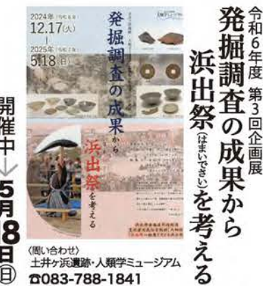
発掘調査の成果から 浜出祭を考える

開催中 5月18日(日) 土井ヶ浜遺跡・人類学ミュージアム 7年に1度の「浜出祭」が開催されます。田耕から土井ヶ浜祭場までの「大行列」と土井ヶ浜祭場(土井ヶ浜遺跡)人類学ミュージアムの駐車場(お祭り広場)で行われる「座」行事からなる盛大な祭礼行事です。