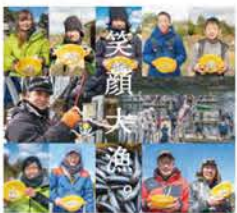
第49回豊田湖ワカサギ釣り大会

開催日 2月9日(日) 受付:午前5時40分、大会開始:6時30分 大会終了:10時30分、検量開始:10時40分 検量締切:11時30分 場所 豊田湖畔公園 下関市豊田町大字 地吉34-8 中国自動車道「小月」インターから35分、バス停「百谷野」から徒歩25分