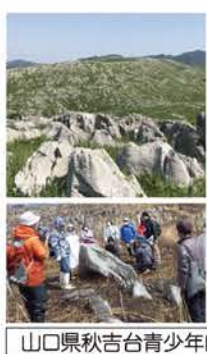
山口県秋吉台青少年自然の家

秋吉台ハイキング 山焼き後の自然を 観察しよう 日本ジオパークに認定された秋吉台で、秋吉台科学博物館の学芸員から自然や歴史、化石等の説明を聞きながら、山焼き後の約4キロをハイキングし自然を体感します。 期日 3月8日(土) 定員 40名程度 対象 小学3年生以上(中学生以下は保護者同伴)