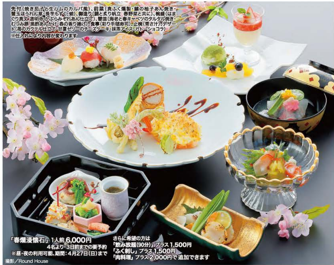
先付(焼き茄子と生ハムのカルパÇO)、前菜(真ふく燻製・鱈の柚子あん焼き・蟹玉ほうれん草・長芋もずく・蛸)、御造り(鯛と炙り帆立 春野菜と共に)、椀盛(はまぐり真丈・道明寺がぶらみぞれあん仕立て)、響皿(海老と春キャベツのタルタル焼き・むつみ豚 黒酢あんかけ・春の香り揚げの食卓(彩り手毬寿司)・止椀(青さじ)デザート(苺のカクテル仕立て・甘夏ゼリーのチーズケーキ・抹茶アイス・ガトーショコラ)

「春爛漫懐石」1人前 6,000円 4名より・3日前までの要予約 ※昼・夜の利用可能、期間: 4月27日(日)まで さらに希望の方は 「飲み放題(90分)」プラス1,500円 「ふく刺し」プラス1,500円 「肉料理」プラス2,000円で追加できます