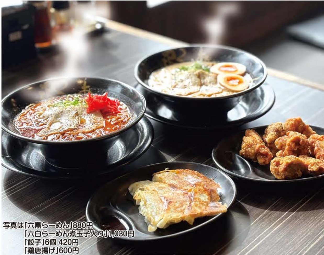
写真は「六黒らーめん」880円 「六白らーめん煮玉子入り」1,030円 「餃子」6個 420円 「鶏唐揚げ」600円

口当たりなめらかで食べ進めるほどに豊かさを増す、旨みたっぷりの豚骨ラーメンが人気の『らーめん食堂 ろくの家』。