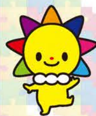
マスコットキャラクターさんまるちゃん