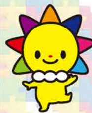
マスクットキャラクターさんまるちゃん