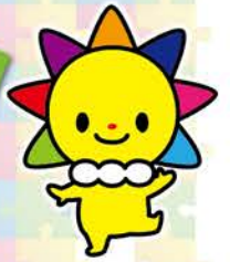
マスコットキャラクターさんまるちゃん