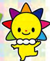
マスコットキャラクターさんまるちゃん