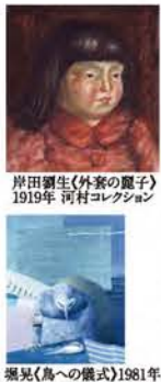
所蔵品展 No.170 作品の「まわり」に 目を向けてみたら シュルレアリスム コレクシオンでみる シュルレアリスム