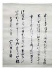
山縣有朋和歌書 (東行庵蔵・当館寄託)

本展のおすすめ資料は、高杉晋作が着用した直垂(ひたたれ)です。直垂は武士の礼装であり、晋作は萩藩主毛利敬親から下賜(か)された直垂を着用して、下関戦争の休戦講和交渉に臨みました。この機会にぜひ来館して、実物を見てみませんか。