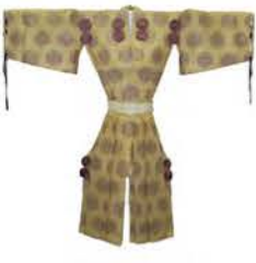
直垂(ひたたれ) 当館蔵